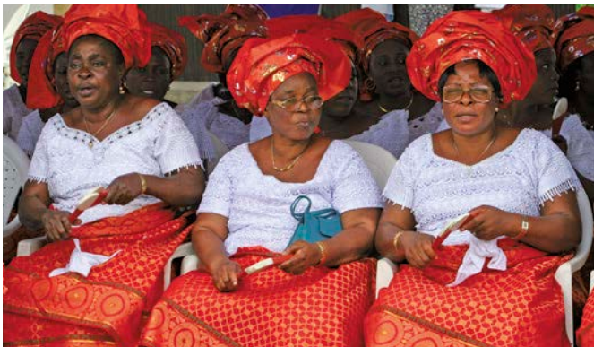
◀ Donne igbo abbigliate per una festa.