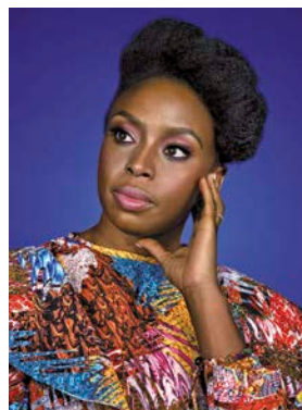
▲ Chimamanda Ngozi Adichie.

“Trecento invitati. Non è una sciocchezza!”, disse mia madre. Le sue parole erano stratificate, dense di complimenti inespresi: che moglie devota era zia Chinwe, com'era straordinario che spendesse i suoi soldi per quella festa, com'era magnifico che ce li avesse quei soldi, tanto per cominciare. Zia Chinwe neutralizzò l'ammirazione di mia madre con la naturalezza di una persona abituata ai