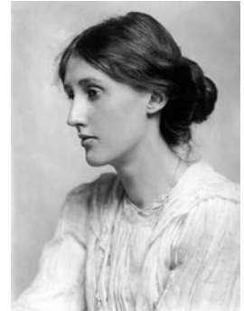
▲ Ritratto di Virginia Woolf.

Nel saggio Una stanza tutta per sé (1929), la scrittrice britannica Virginia Woolf (1882-1941) parla del difficile rapporto tra donne e letteratura. È la storia di un'esclusione: le donne sono state tenute lontane dalla politica, dall'arte e nello specifico dalla letteratura. Le voci femminili hanno dovuto superare ostacoli sconosciuti agli uomini per arrivare a essere ascoltate. Per illustrare la sua tesi, Woolf racconta la storia di Judith Shakespeare, un'immaginata sorella del drammaturgo William, con il quale condivide un'innata propensione per il teatro. Come leggerai nel testo seguente, la vita di Judith seguirà una parabola ben diversa da quella del fratello.